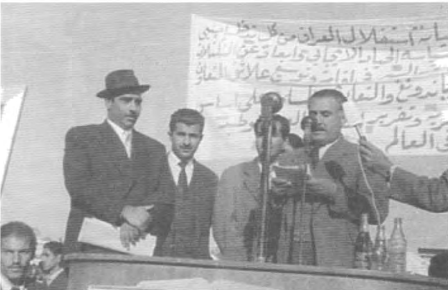
له یادکردنه‌وه‌یه‌کدا له‌گه‌ل مامۆستا برایم نه‌حمه‌ددا